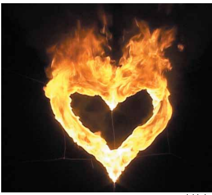
הילה לולו ליו

הגלריה בבארי קיבוץ בארי, 85135 זיוה ילון; 054-7918049, 08-9949512 zivaj@beeri.org.il מועדי הפתיחה: יום ה' 18:00 - 19:00; יום ו' 10:00 - 12:45; 19:30 - 20:30; שבת 11:30 - 14:30; או בתיאום מראש עם זיוה ילון.